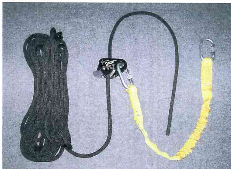
„JOULE 70 W4100/, typ Fall absorber“ v kombinaci s výrobkem „LOCKER W1010/, typ Zachycovač pádu, Nastavovač délky“ „JOULE 70 W4100/, type Fall absorber“ in combination with product „LOCKER W1010/, type Full Arrestor, Length Adjuster“