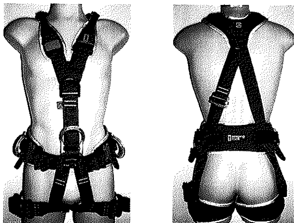
"PROFI WORKER SPEED III /W0082/, type Full Body Harness"