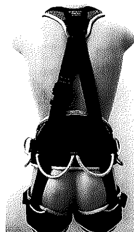
"PROFI WORKER 3D STANDARD /W0081D/, type Full Body Harness"

Kopírování částí tohoto dokumentu je povoleno se souhlasem VVUÚ, a.s., NB 1019, v Ostravě – Radvanicích. Duplication of this document in parts is subjected to the approval by VVUÚ, a.s., NB 1019, in Ostrava – Radvanice, Czech Republic.