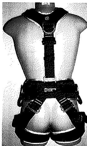
"EXPERT SPEED STEEL III /W0080/, type Full Body Harness"